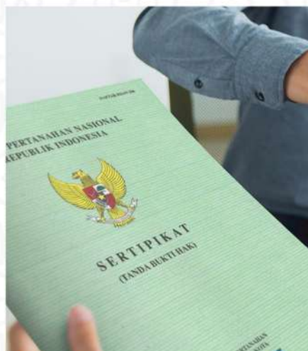
IMB & SHM SUDAH PECAH