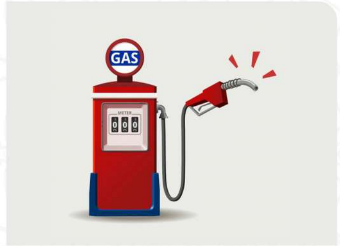
FASILITAS SEKITAR LENGKAP