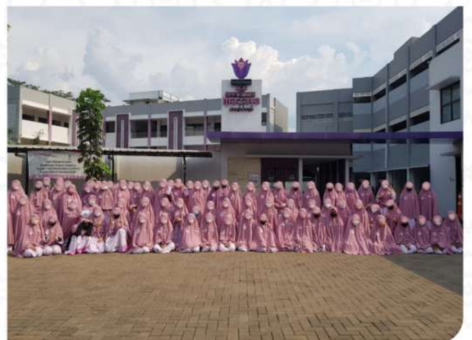
SMP SMA MAZAYA SUNNAH