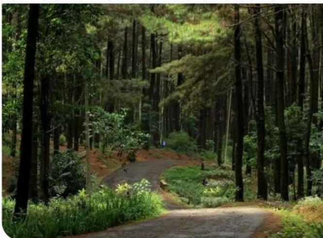
HUTAN PINUS CIBUBUR