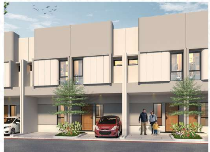
DESAIN MODERN MINIMALIS