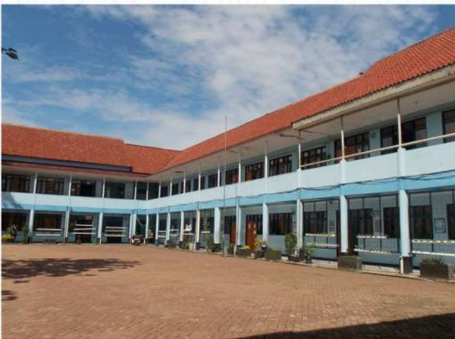
SMAN 7 DEPOK