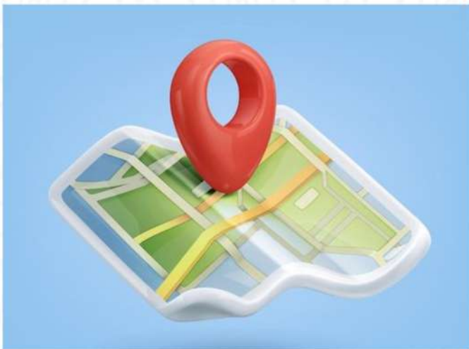
LOKASI SANGAT STRATEGIS