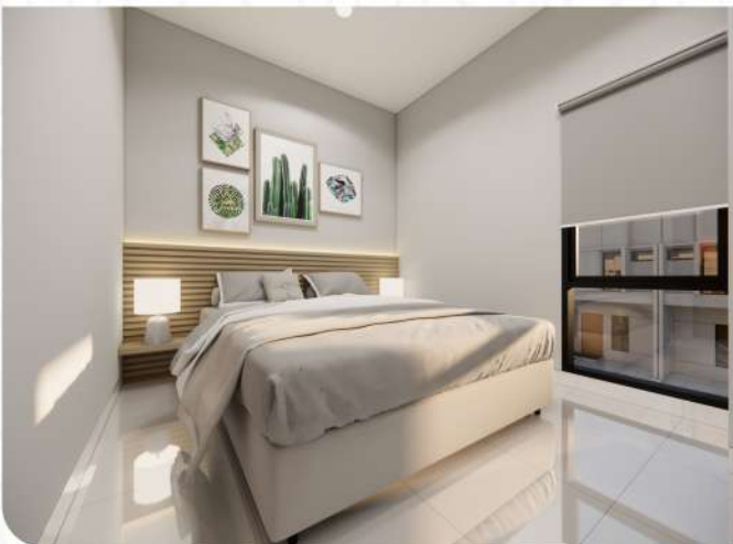
BED ROOM 2