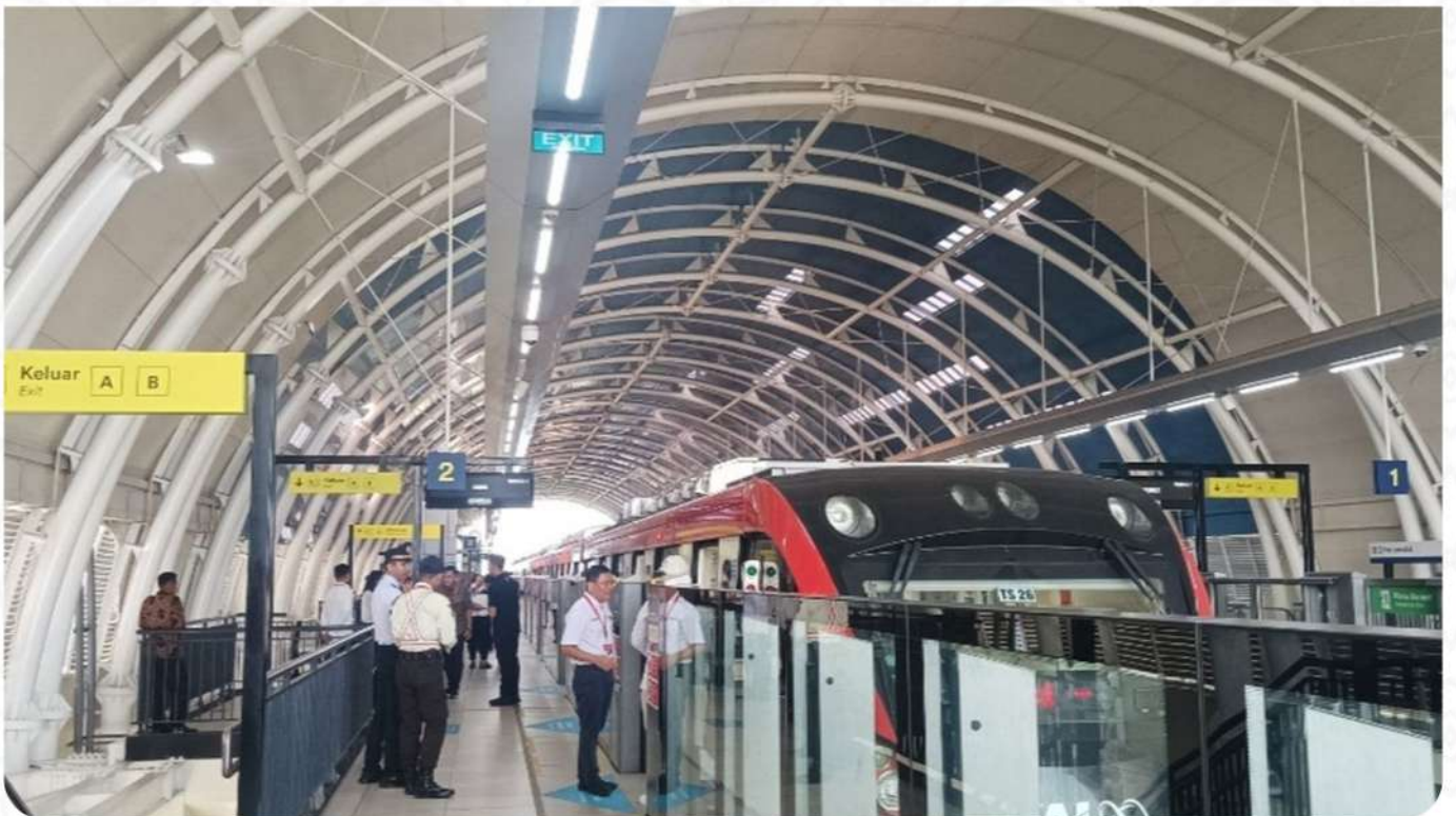
STASIUN LRT HARJAMUKTI