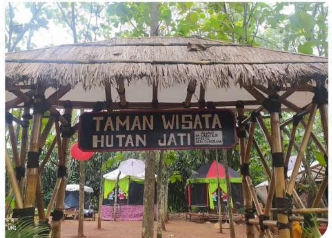
TAMAN WISATA HUTAN JATI