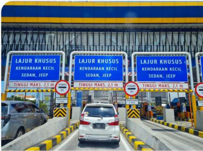
DIAPIT OLEH 3 GATE TOL