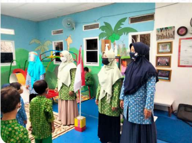
TAAM INSAN CENDIKIA