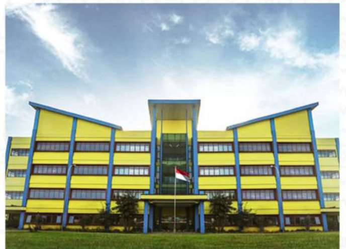
SD QUANTUM INTI INDONESIA