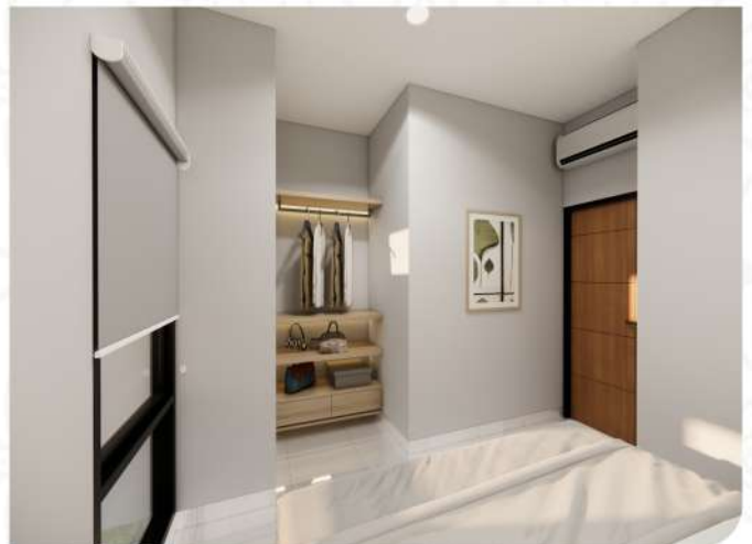
BED ROOM 2