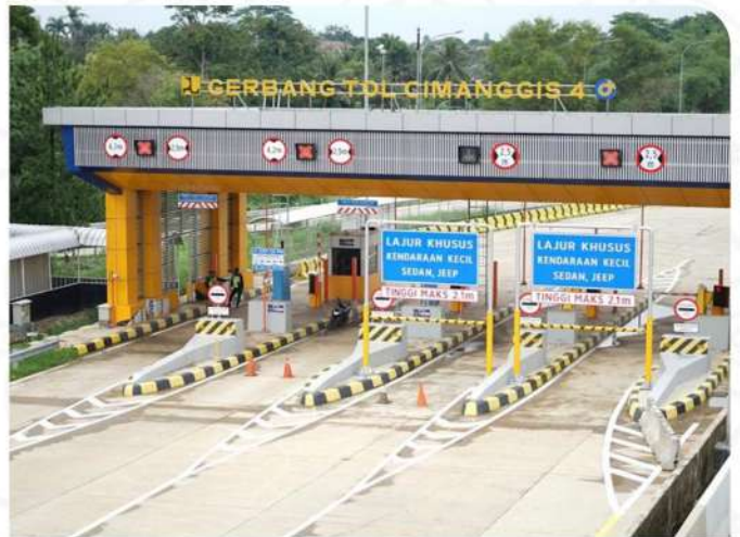
GERBANG TOL CIMANGGIS