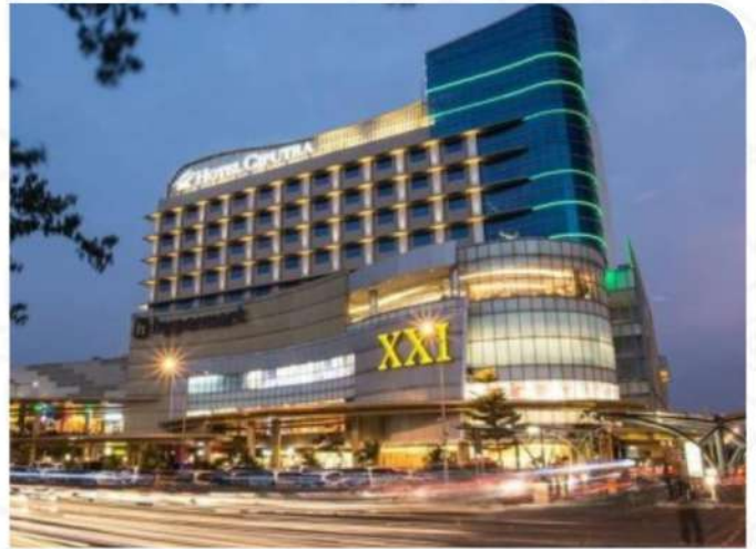
MALL CIPUTRA CIBUBUR