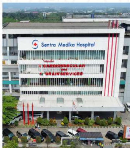
SENTRA MEDIKA HOSPITAL