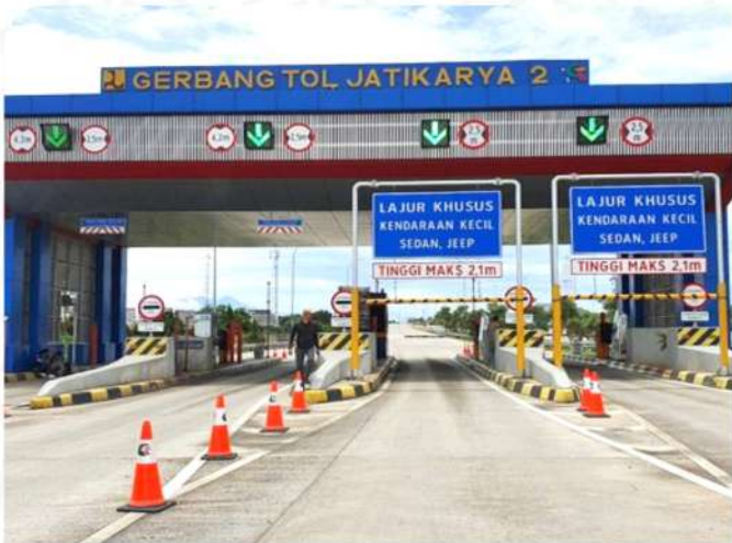
GERBANG TOL JATIKARYA