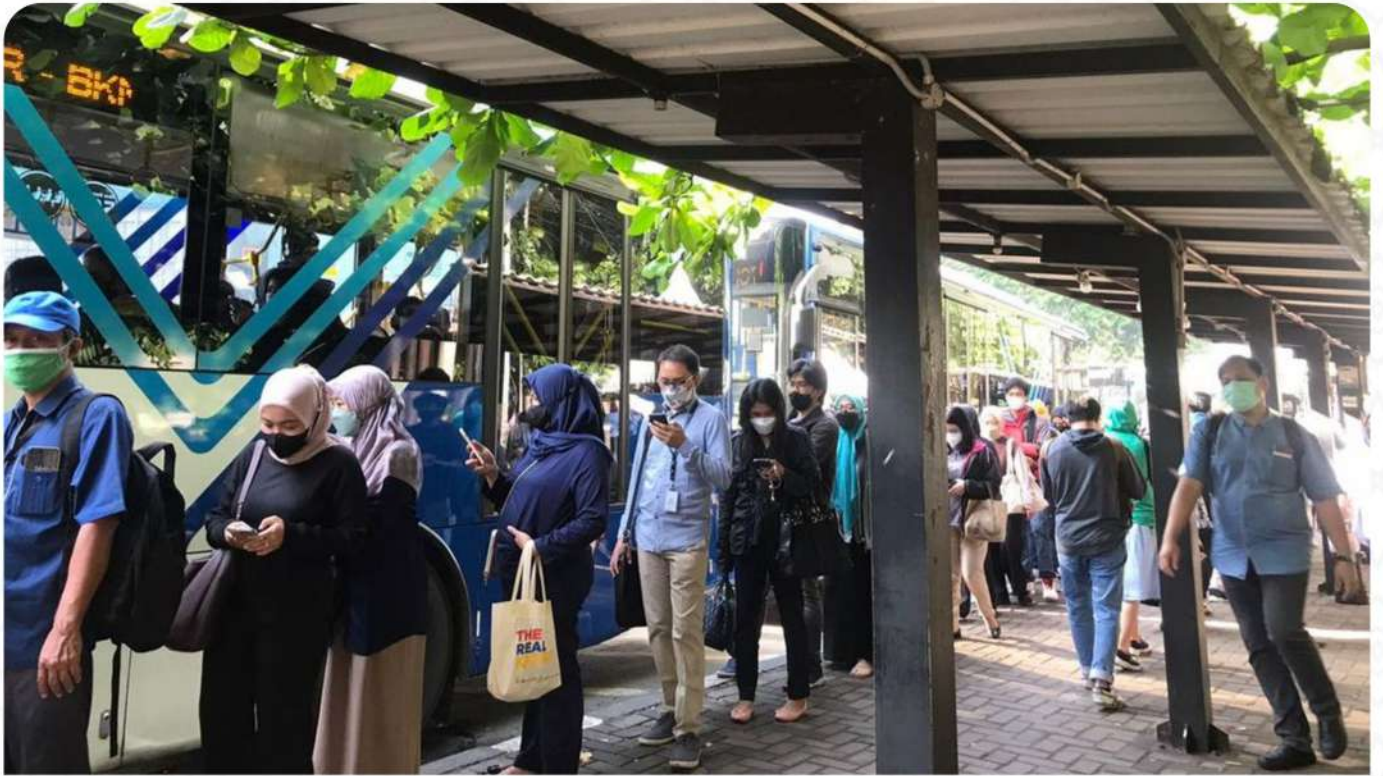
HALTE TRANSJAKARTA CIBUBUR JUNCTION