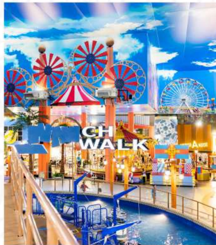
TRANS STUDIO CIBUBUR