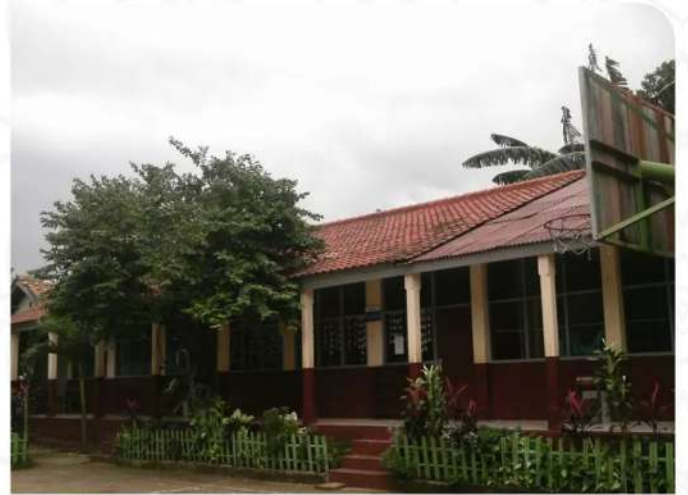
SDN JATIKARYA 3