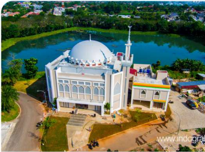
AL QOLAM MOSQUE CITRAGRAND