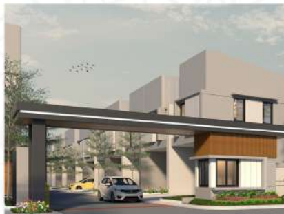
ONE GATE SYSTEM