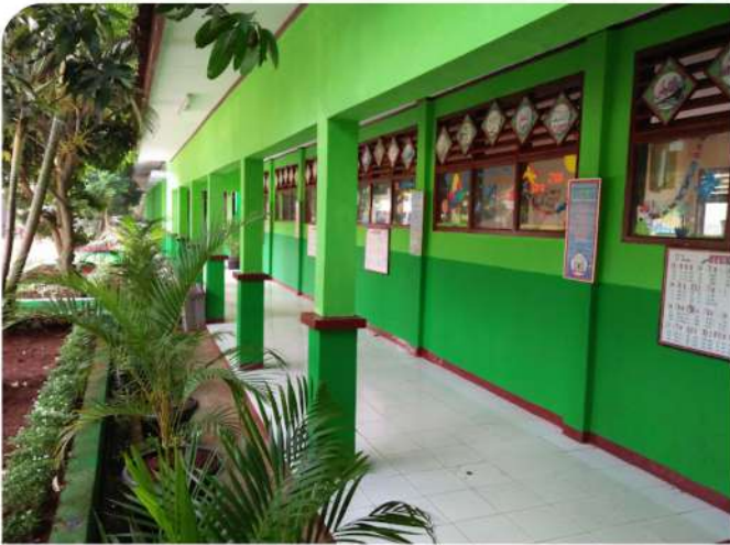
SDN JATIKARYA 4