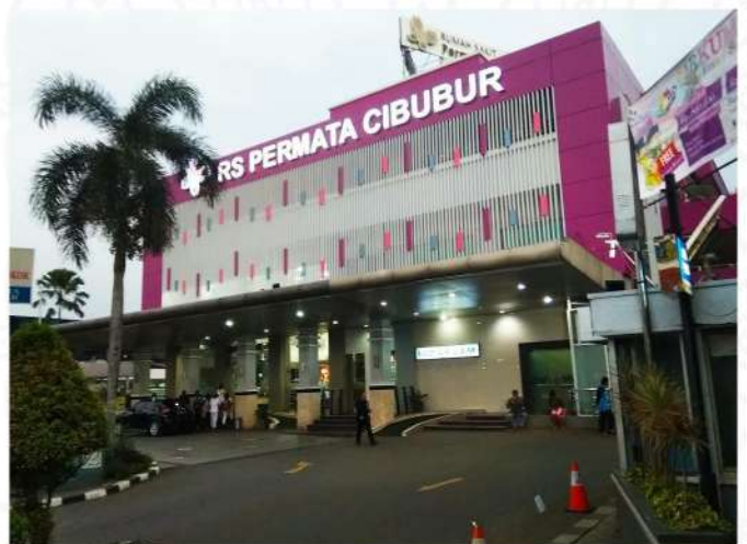
RS PERMATA CIBUBUR