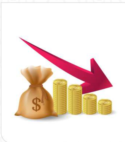
HARGA AFFORDABLE & KOMPETITIF