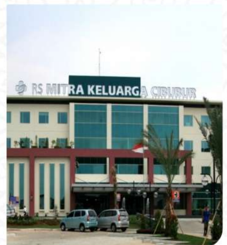
RS MITRA KELUARGA