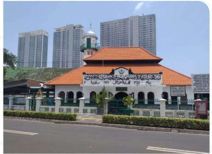
MASJID JAMI AL MAKMUR