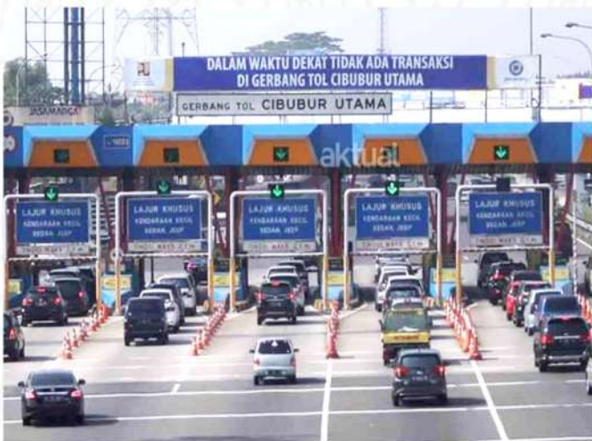
GERBANG TOL CIBUBUR